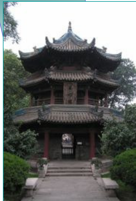
Minarete de la Gran Mezquita, en estilo chino

La gran mezquita está ubicada en el barrio musulmán de la ciudad de Xi'an. En esta zona se encuentran otras doce mezquitas de menor tamaño. Se trata de un barrio con un estilo peculiar que le diferencia de otras de la ciudad. Las calles estrechas suelen estar plagadas de pequeños puestos de venta ambulante que se alternan con puestos de comidas.