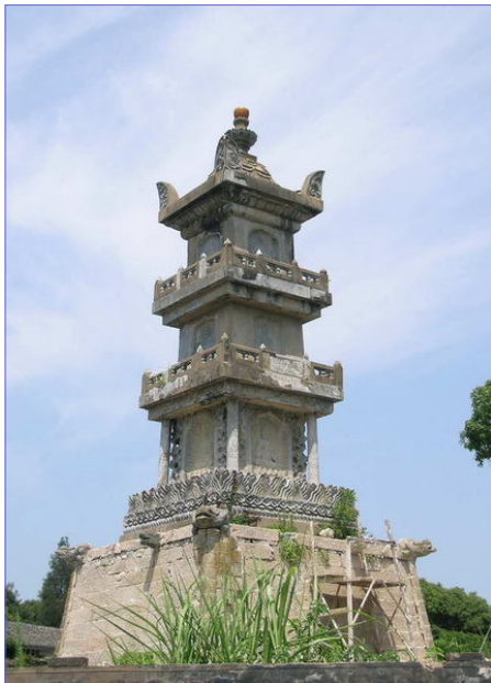
Torre – Pagoda

Su material de construcción es generalmente la madera y el ladrillo. Las columnas suelen tener escasa elevación y carecen de capitel. Las techumbres o cubiertas se completan con un alero grande cuyo borde, sobre todo en sus puntas, se encorva hacia arriba. Aunque más ordenada en la ornamentación que la arquitectura india, se usan en ella variadas decoraciones policromadas: azulejos, baldosines de porcelana, incrustaciones, campanillas y juguetes, con nimiedad de detalles.