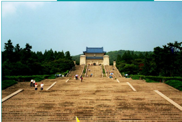
Mausoleo de Sun Yat-sen en Nanjing.

El Mausoleo de Sun Yat-sen está en la ciudad de Nanjing, en la provincia de Jiangsu de la República Popular China. Fue construido por el arquitecto Lu Yanzhi en la ladera de las Montañas Púrpura entre 1926 y 1929. Sun Yat-sen fue enterrado en este lugar el 1 de julio de 1929.