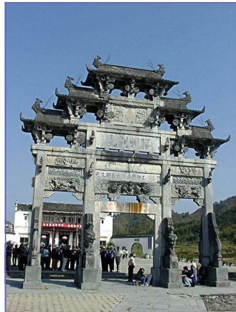
Arco – Triunfal

la taa o torre-pagoda, formada por muchos cuerpos cilíndricos o poligonales superpuestos, llevando cada uno su propio alero el peleu o pai-lu, especie de arco triunfal o puerta monumental de tipo arquivado